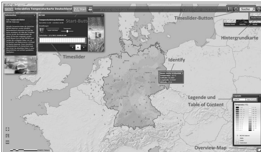
Abbildung 3 Web-Mapping Template Frontend

Wesentliche Grundmodule für das einfach gestaltete Multi-Touch-Kartenlayout sind die abgesetzte Taskleiste (erhöht die wahrgenommene Kartengröße um ca. 12%) mit Titel und einem ‚Start‘ Button für den spezifischen Task einer Applikation (links) und einem Button für das Legendenfenster, einer geographischen Adresssuche und einem Hilfebutton.