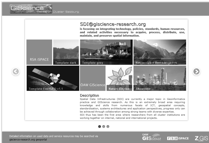
Abbildung 2 Taskaufteilung für maßgeschneiderte Web-Mapping Applikationen

Eine immer wichtiger werdende Rolle spielt die Konzeption eines Storyboards von thematischen Inhalten auf Websites mit integrierten Kartendarstellungen, also die Entwicklung eines Drehbuches für die Vermittlung kartographischer Inhalte, vor allem dann, wenn auch raum-zeitliche Inhalte in die Präsentation integriert werden. Die Aufgliederung der einzelnen Karteninhalte mit Hilfe einer vorgelagerten thematischen Sortierung in verschiedene Mini-Karten-Applikationen (Application-Hub) kann als Ordnungsmittel eingesetzt werden, um ausreichend fokussierte Aufmerksamkeit der Nutzer auf die einzelnen bereitgestellten kartographischen Inhalte zu erzielen. Vergleichbar mit Online-Zeitungsbeiträgen werden die Konzepte der Schlagzeile für die einzelnen Applikationen in die Aufgliederungsseite integriert. Die Schlagzeile dient dem Nutzer als erstes Hilfselement zur Orientierung, welche Karten-App die für ihn/sie interessanten Inhalte besitzt und ist in dieser Form vergleichbar zu bestehenden App-Interfaces mobiler Betriebssysteme und dem Metro-Designkonzept von Windows 8. Auf eine weitere Beschreibung der Karteninhalte wird zur Sicherung der Übersichtlichkeit bewusst verzichtet.